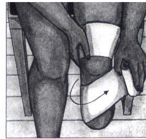
Håll knäet rakt under lindningen.