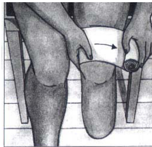
Linda ett par varv ovanför knäet.

Vid frågor vänd er till: Ortopedteknisk avdelning: 054-51 36 12 eller fysioterapimottagningen vid Centralsjukhuset i Karlstad: 010-831 52 28.