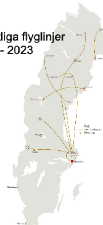
Befintliga flyglinjer 2019 - 2023