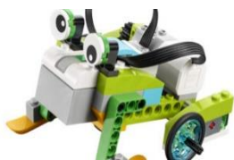
LEGO WeDo 2.0

Vi har fem olika sorter och lånetiden är max 4 veckor i taget. Du hittar dom på www.sliplay.se/mediecentervarmland