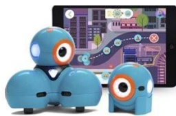
Dash & Dot