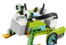
LEGO WeDo 2.0

Vi har fem olika sorter och lånetiden är max 4 veckor i taget. Du hittar dom på sliplay.se/mediecentervarmland