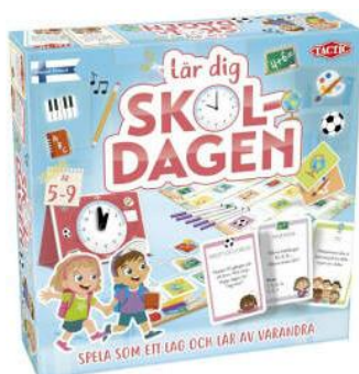
bild - Lika på lika - Memory - Bildlotto - Bingo. Avsett att användas i grundsärskolan men passar även inom förskolan.

Med hjälp av de olika slöjdspelen skapas intresse för de ord som används i slöjden. De sex olika spelen bygger på ett gemensamt basmaterial där fotografier illustrerar dessa ord. Att träna med hjälp av spel gör träningen av slöjddorden mer variationsrik och lustfylld. Spelen utgår från 16 olika slöjdbilder. Varje bild är ett fotografi av ett föremål som används på slöjdlektionerna. I varje spel ingår de 16 slöjdbilderna. Följande slöjdspel finns: - Hitta bilden - Sortera ord och