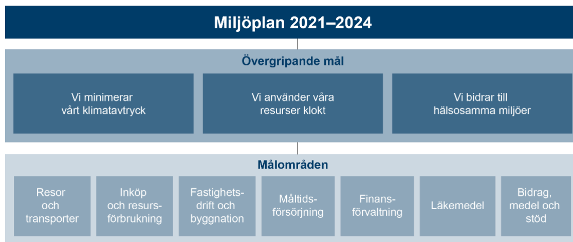
Figur 1. Region Värmlands Miljöplan 2021 - 2024

Planen består av tre övergripande mål och av sju målområden med både långsiktiga mål och mer kortsiktiga som ska uppfyllas till 2024. Dessa baseras bland annat på regionens egna utgångspunkter, målen i Agenda 2030, Parisavtalet, nationella miljömål samt andra regionala planer och strategier som bedömts relevanta för ändamålet. Enligt miljöplanen bidrar varje målområde till minst ett av de övergripande målen.