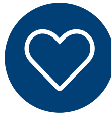
Vi bryr oss