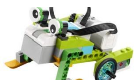
LEGO WeDo 2.0

Vi har fem olika sorter och lånetiden är max 4 veckor i taget. Du hittar dom på www.sliplay.se/mediecentervarmland