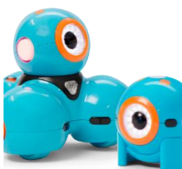
Dash & Dot