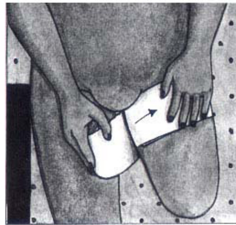
Linda 2-3 varv runt låret.

Vid frågor vänd er till: Ortopedteknisk avdelning: 054-51 36 12 eller fysioterapimottagningen vid Centralsjukhuset i Karlstad: 010-831 52 28.